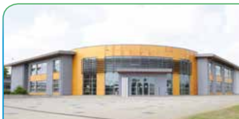
Ecole 2 Op Acker