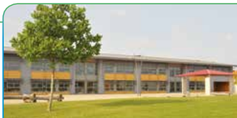
Ecole 1 Op Acker