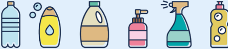
Bouteilles et flacons en plastique · Plastikflaschen und -flakons · Plastic bottles and containers