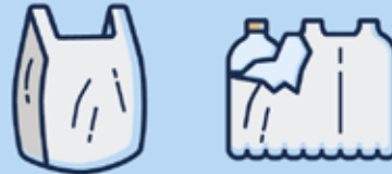
Films et sacs en plastique · Plastikfolien und -tüten · Plastic films and bags