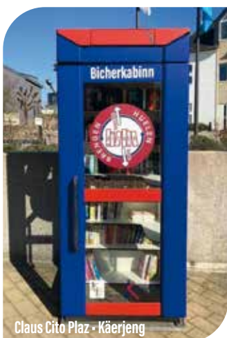
Claus Cito Plaz - Käerjeng

Nous comptons sur la discipline de nos citoyens afin de maintenir les boîtes à livres dans un état propre.