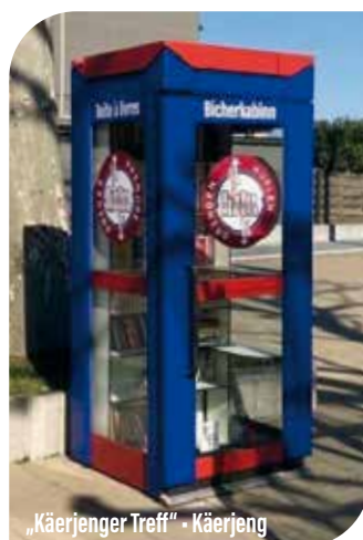
„Käerjenger Treff“ - Käerjeng