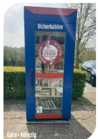
Gare - Kéinzig