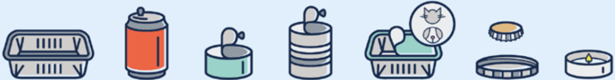
Emballages métalliques · Metallverpackungen · Metal packaging