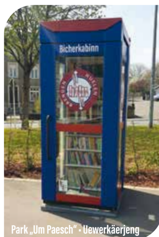
Park „Um Paesch“ - Uewerkäerjeng