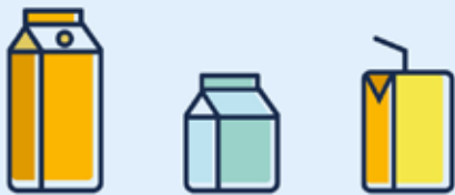
Cartons à boisson · Getränkekartons Beverage cartons