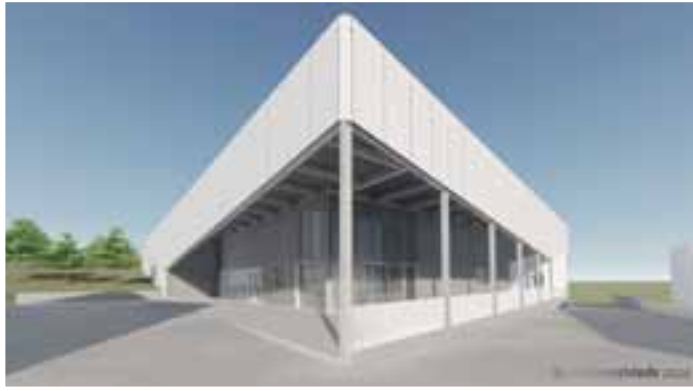
3D - Angle sud-est / auvent