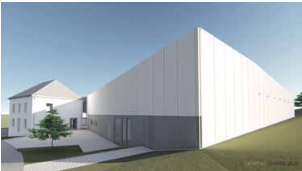
3D - Angle nord-ouest / rue de Sélange