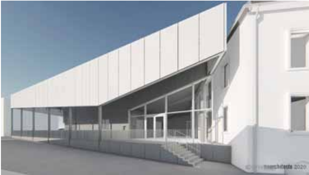
3D - Angle nord-est / entrée principale