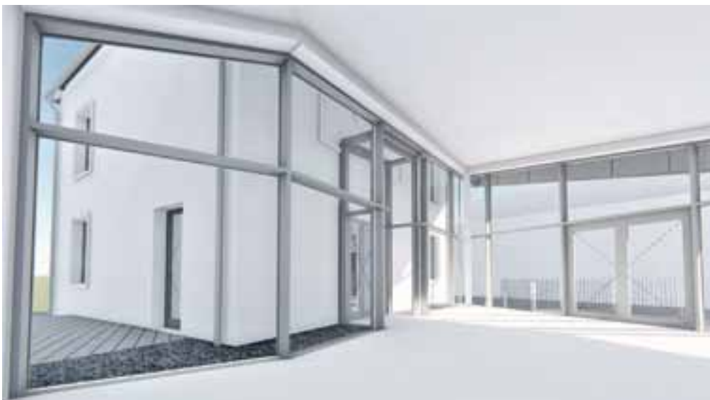
3D - Entrée principale